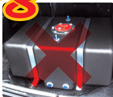
間違った 取付け方向の図 (blankした取出し 口は車輛前側にす ること)