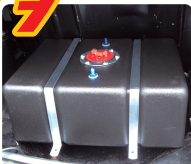
トランクルーム内 レイアウト図 (下部取り出し口を車 輛前側にし、確実に 固定すること) ※内圧膨張防止プリー ザーホースは必ず取 り付け、ホースエン ドは車外に出すこと