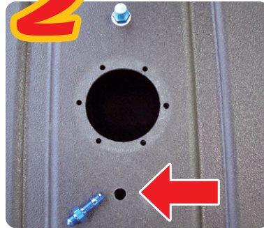
スポンジフォーム をタンクから取外し、タンク上面に フューエル取り出しのための穴を 開ける