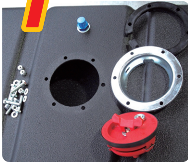
フューエル タンク分解図