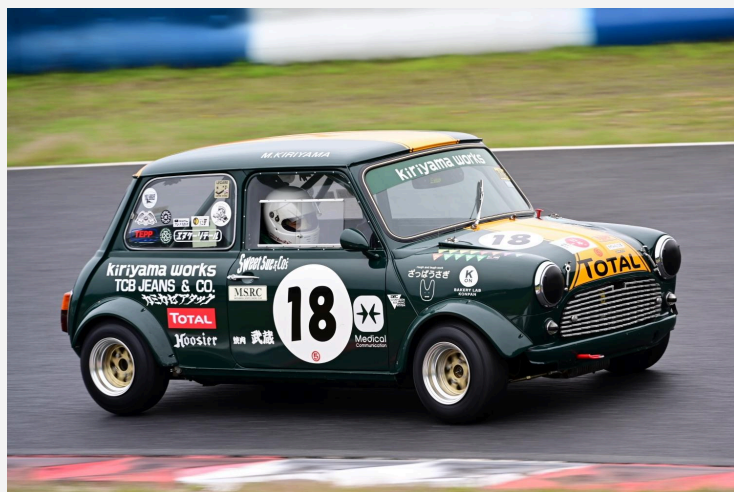
2位 桐山 昌樹 選手 キリヤマワークスレーシング