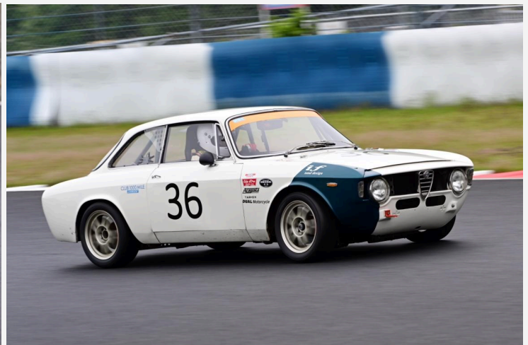
3位 濱田 郁人 選手 クーロードGTV