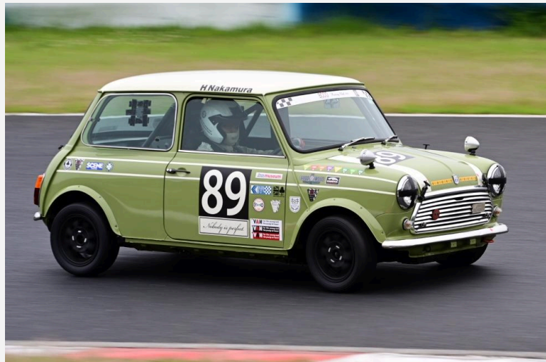
1位 中村 宏選手 BCCO Raicing 89号車