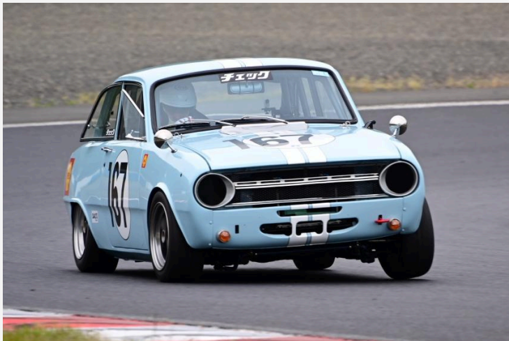
2位 日下 恭一郎 選手 DAD'S67ベレット