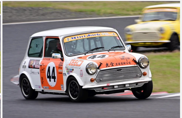
3位 森 一之義選手 AAP SEELD