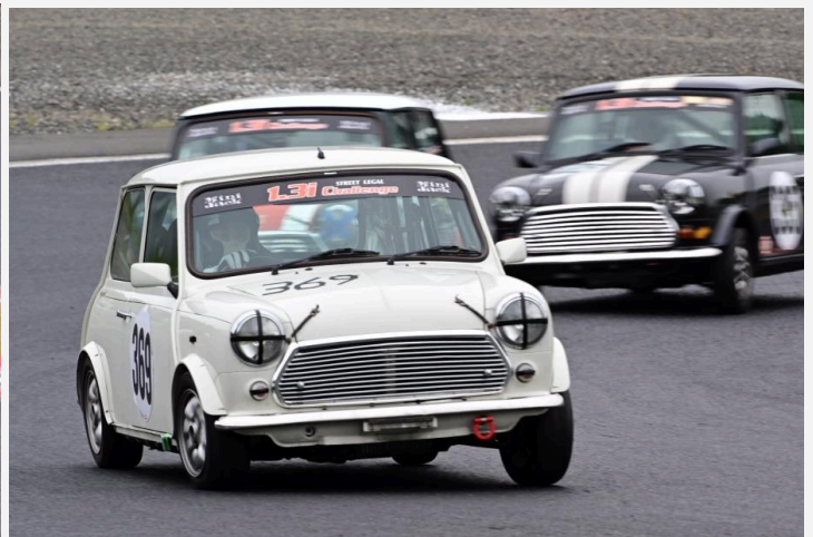
3位 高橋 正樹選手 CLUCRU-COW