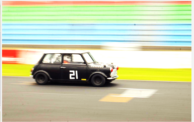
3位 倉本 一史選手 VTECレーシング・ライド