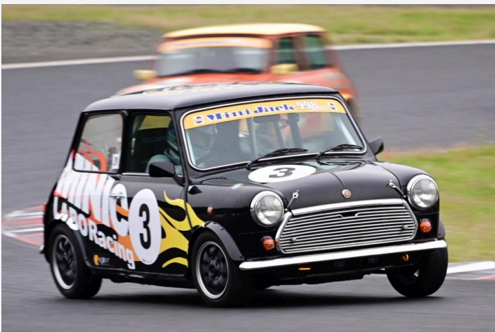
2位 吉村 英晴選手 MINIC RACING