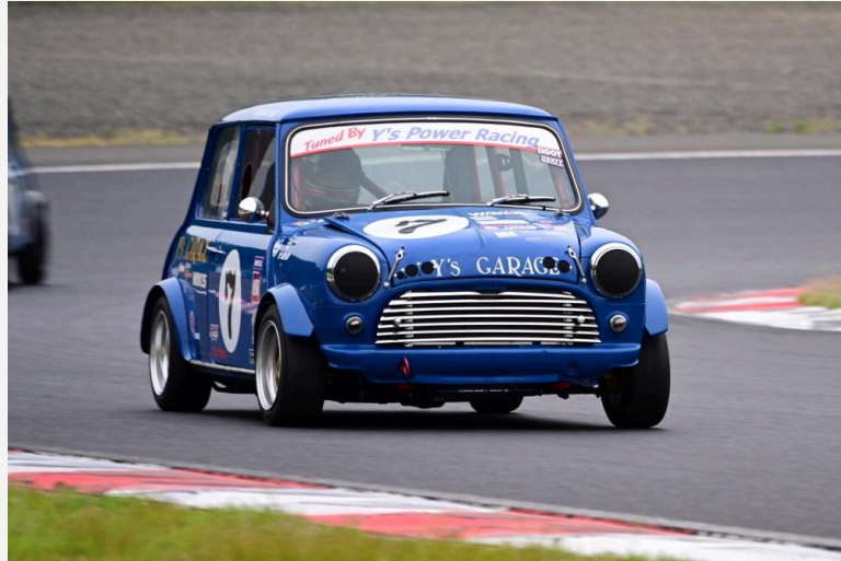
1位 小野 直弘 選手 ワイズレーシング2号車