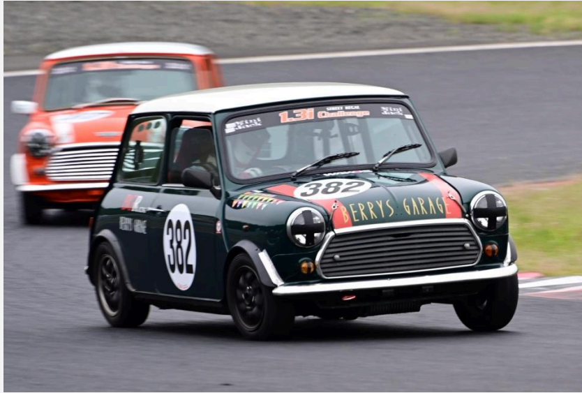
1位 森本 一弘選手 BGLレーシング1.3iチャレンジ