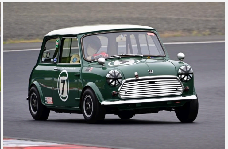
2位 野村 敏之選手 モーリスミニクーパース 3位 小山 英樹選手 オースチンミニP68