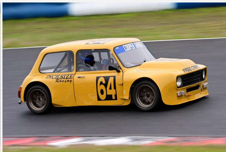
3位 宮田 聖一 選手 クーパーガレージマガワイヤー