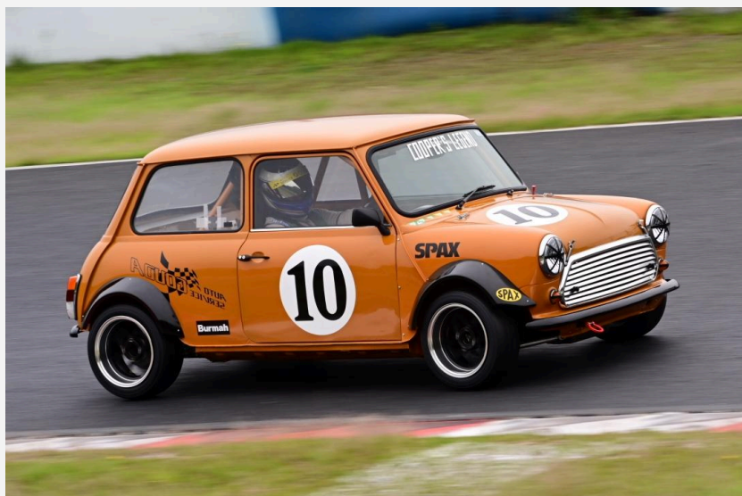
1位 北野 義博 選手 クーパーレジェンドMOTO5