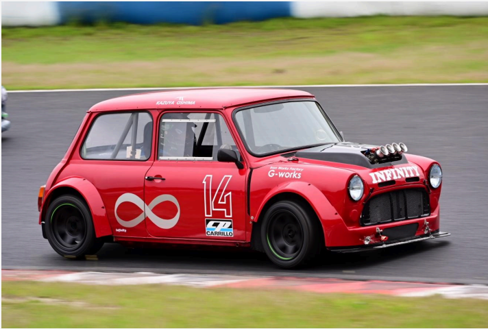
2位 大島 和也選手 インフィニティミニ