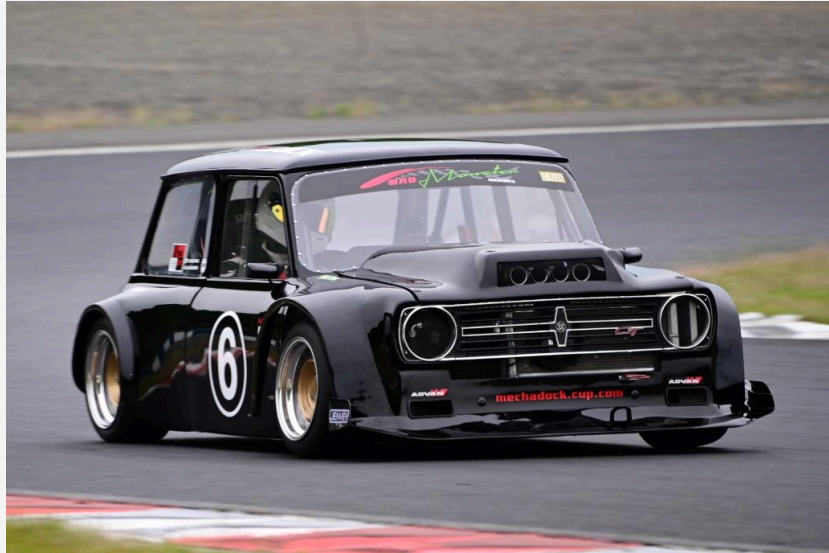
1位 長崎 紀治選手 メカドッグ・RGモンスター