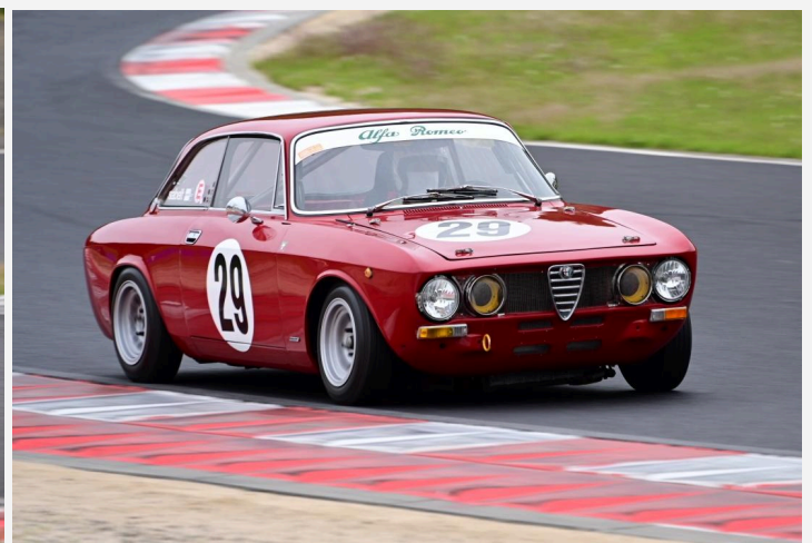
1位 大西 剛選手 JRCパワーステアス1 2位 岩川 成三選手 柳原メンテナンスロメオ2000