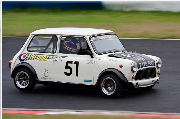
3位 三田 勇理 選手 FIVEPORT RACING