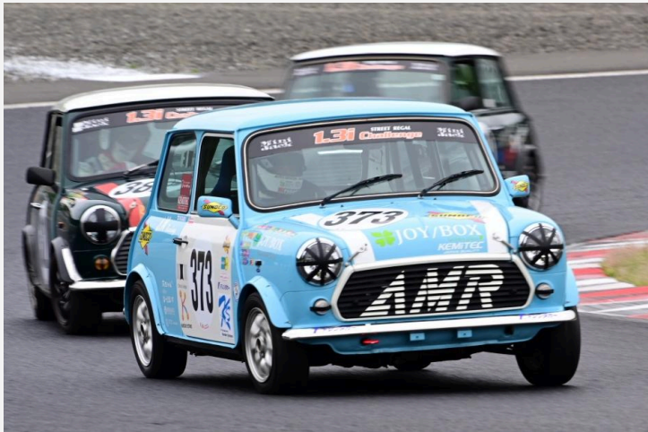
2位 南海 太郎選手 AMRACING3号車