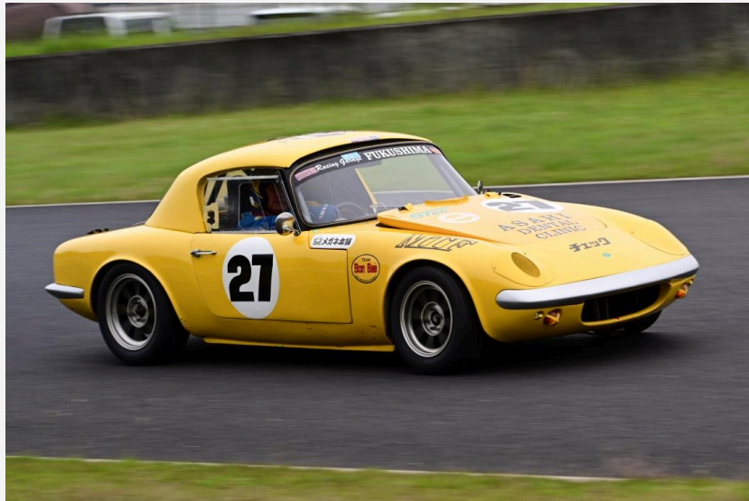
1位 林 誠選手 ガルト1300クーペ