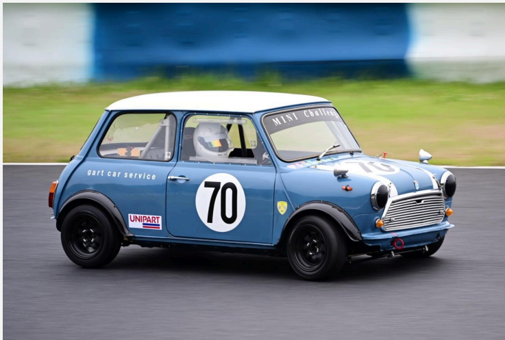
2位 片山 洋介 選手 ガルトミニ1300