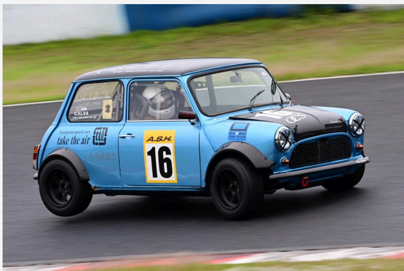
1位 大谷 泰博 選手 tta ohtani mini