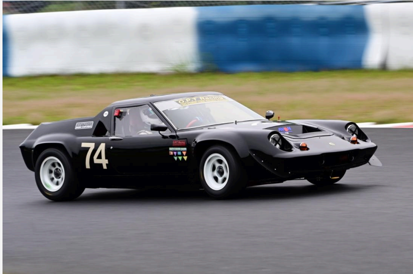
1位 長浜 元之 選手 OPTヨーロッパ