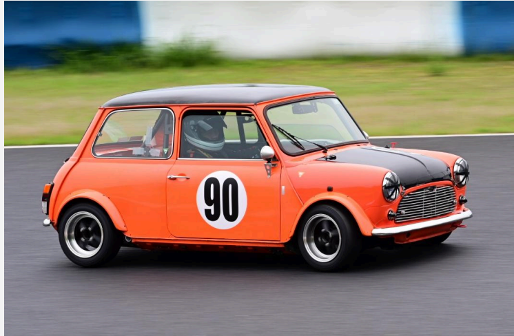
2位 福村 勝央選手 HOTDOG Raicing TKT