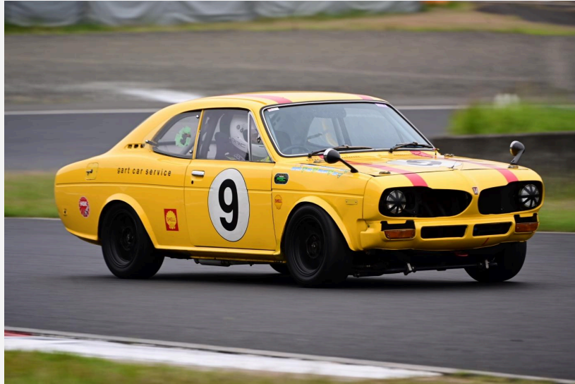
1位 林 誠選手 ガルト1300クーペ